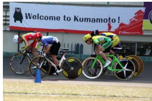
全国高等学校選抜自転車競技大会（トラック）