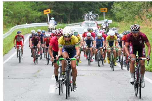
全日本学生自転車競技トラック新人戦