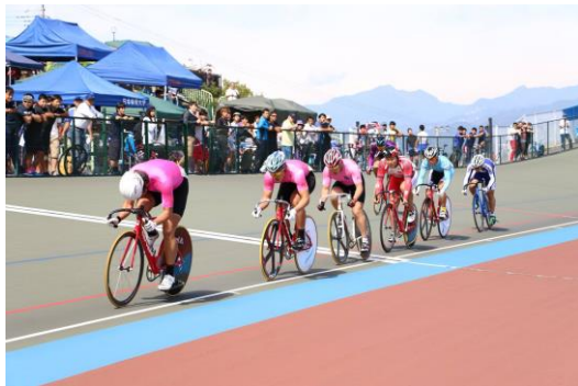
全日本大学対抗選手権