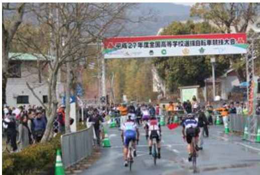
全国高等学校選抜自転車競技大会（ロード）

①全国高等学校体育連盟自転車競技専門部（高体連）事業 http://www.hs-cycling.com/