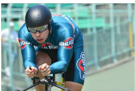
1 kmタイムトライアル