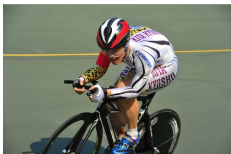
4 km個人パーシュート