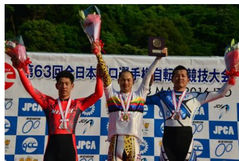
4 km個人パーシュート表彰