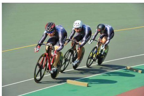
チームスプリント