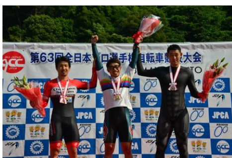
1 kmタイムトライアル表彰