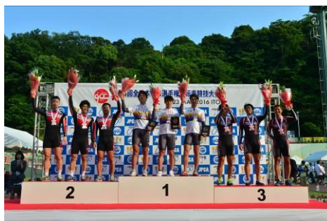
チームスプリント表彰