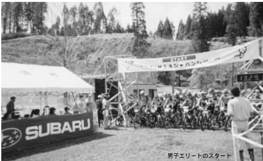
男子エリートのスタート

4月7日(日)前日の雨が上がり天気は快晴。2002年のジャパンシリーズ・クロスカントリー第1戦が熊本県阿蘇郡小国町で開催された。