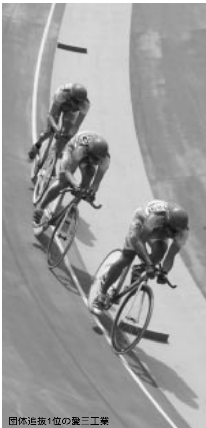
団体追抜1位の愛三工業