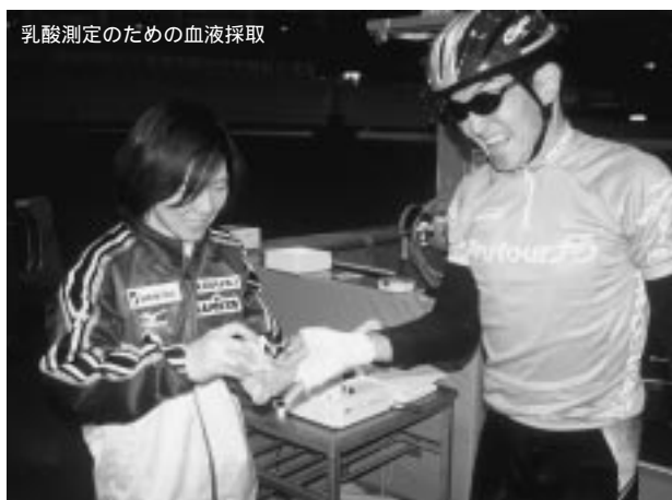
乳酸測定のための血液採取