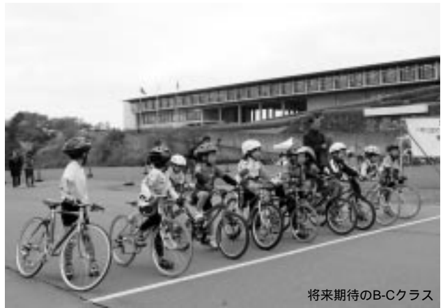
将来期待のB-Cクラス