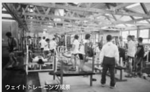
ウエイトトレーニング風景