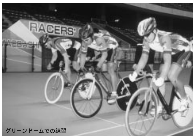
グリーンドームでの練習