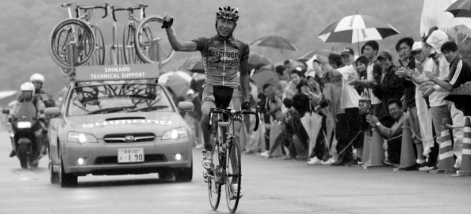
余裕の単独フィニッシュ、別府