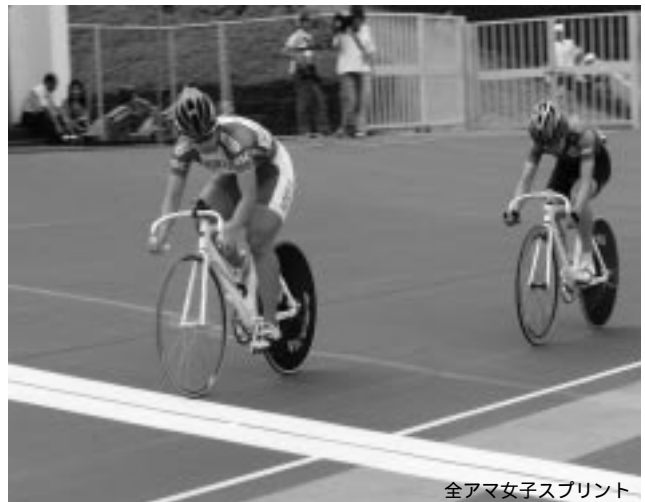
全アマ女子スプリント