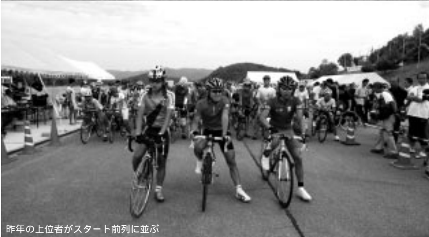
昨年の上位者がスタート前列に並ぶ