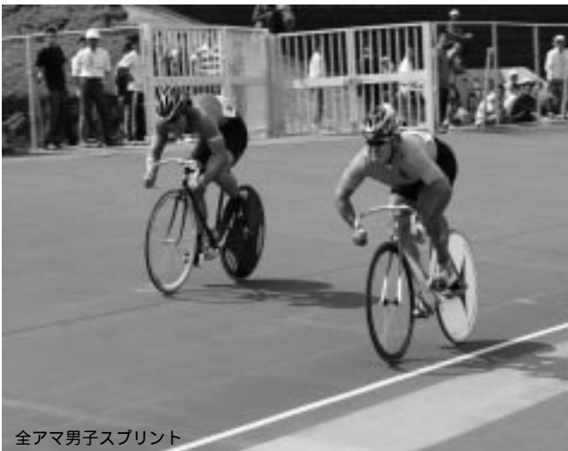
全アマ男子スプリント