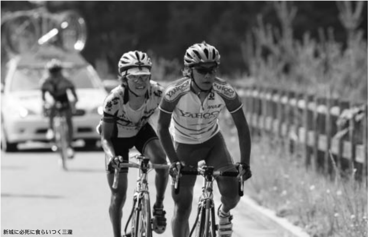
新城に必死に食らいつく三瀧