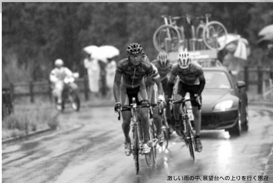
激しい雨の中、展望台への上りを行く別府