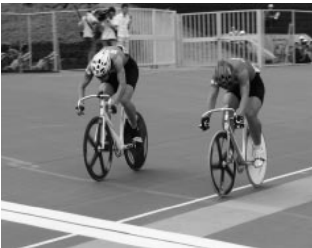
JOCカップ男子スプリント