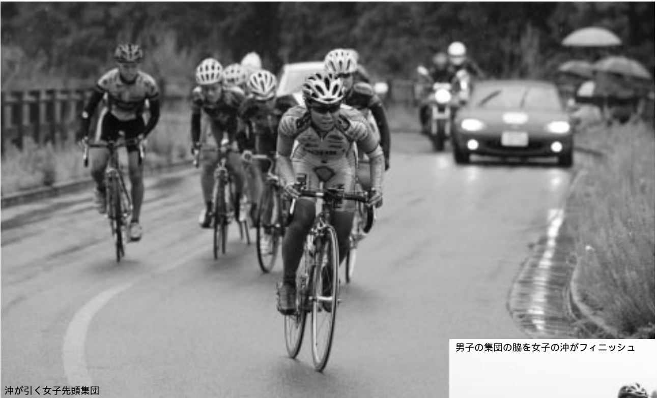
沖が引く女子先頭集団