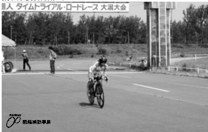
女子チャンピオン沖のスタート