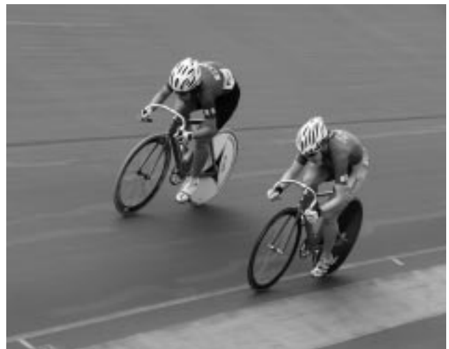
JOCカップ女子スプリント