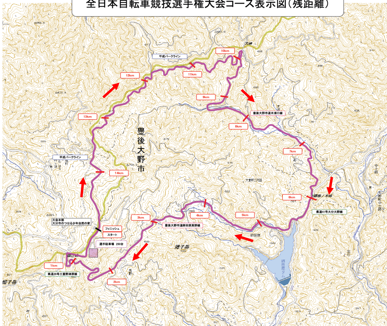
全日本自転車競技選手権大会コース表示図(残距離)

なお前述のコース周回方向変更により下りとなる区間の一部について、今後、転落防止用のネットフェンスなどの防護施設を設置予定であるが、現時点ではこうした防護施設が充分でない区間もある。くれぐれも試走中に事故のないように注意されたい。