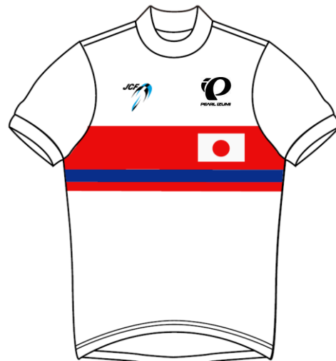
Japan Masters National Champion Jersey