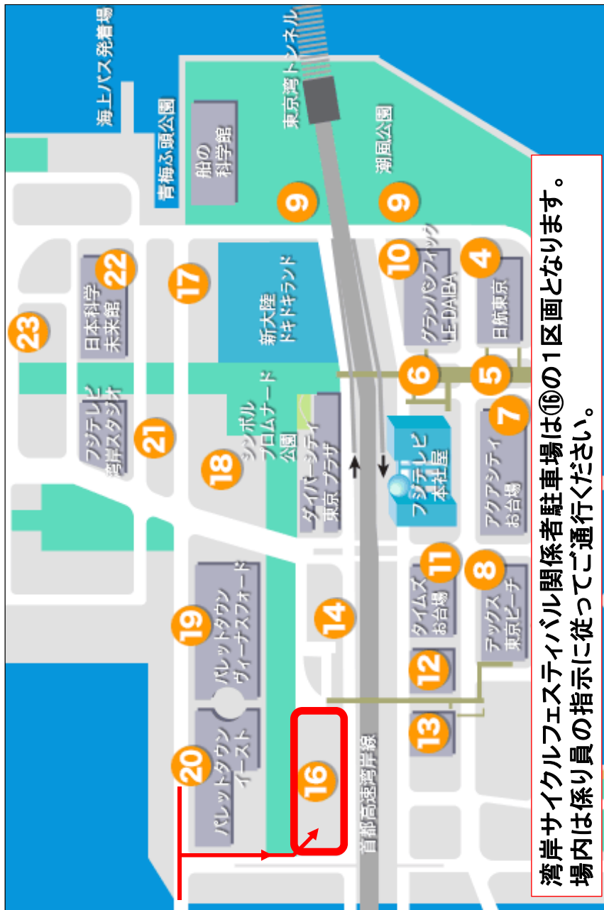
湾岸サイクルフェスティバル 駐車場案内図