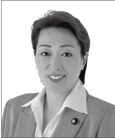
公益財団法人 日本自転車競技連盟 会 長 橋 本 聖 子

このたび第 83 回全日本自転車競技選手権大会トラックレースと 2014 日本パラサイクリング選手権トラック大会が、東日本大震災の甚大な被害の中から、昨年夏に復旧工事が終わった泉崎国際サイクルスタジアムで開催されますことを誠に喜ばしく思います。