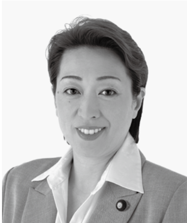
公益財団法人 日本自転車競技連盟 会 長 橋 本 聖 子

このたびJOC ジュニアオリンピックカップ自転車競技大会と2013全日本オムニウム選手権大会が、オリンピックや世界選手権大会が行われる競技場と同じ規格で建設された、ここ静岡県伊豆市の日本サイクルスポーツセンター・伊豆ベロドロームで開催されますことを誠に喜ばしく思います。