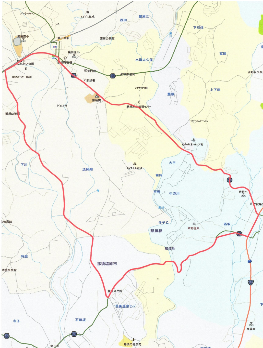
第84回全日本自転車競技選手権ロードレース那須大会 断面図