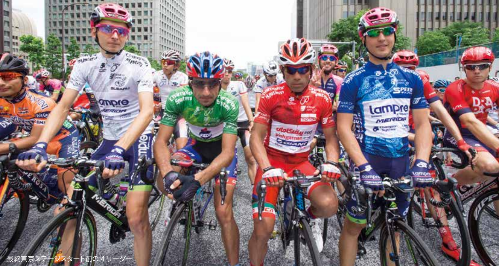
最終東京ステージスタート前の4リーダー

5月17日から24日まで、第18回ツアー・オブ・ジャパン（アジアツアークラス2.1）が自転車月間推進協議会の主催で行われた。