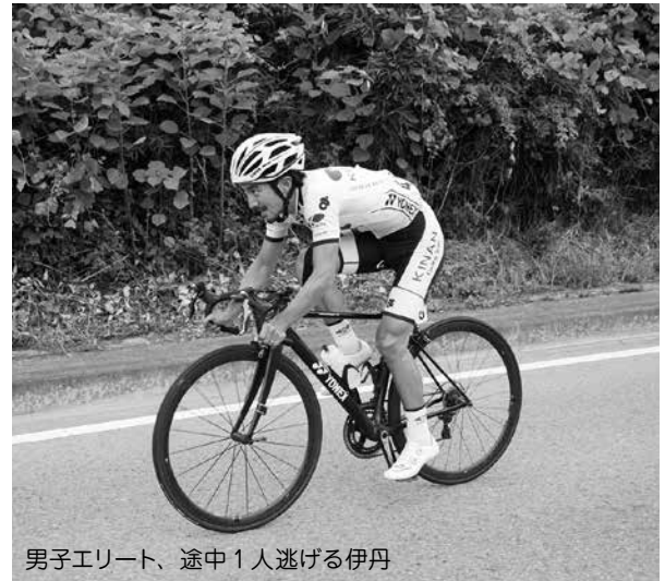
男子エリート、途中1人逃げる伊丹