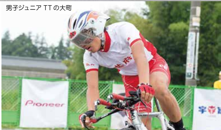
男子ジュニアTTの大町