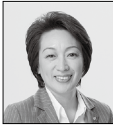
会 長 橋本 聖子