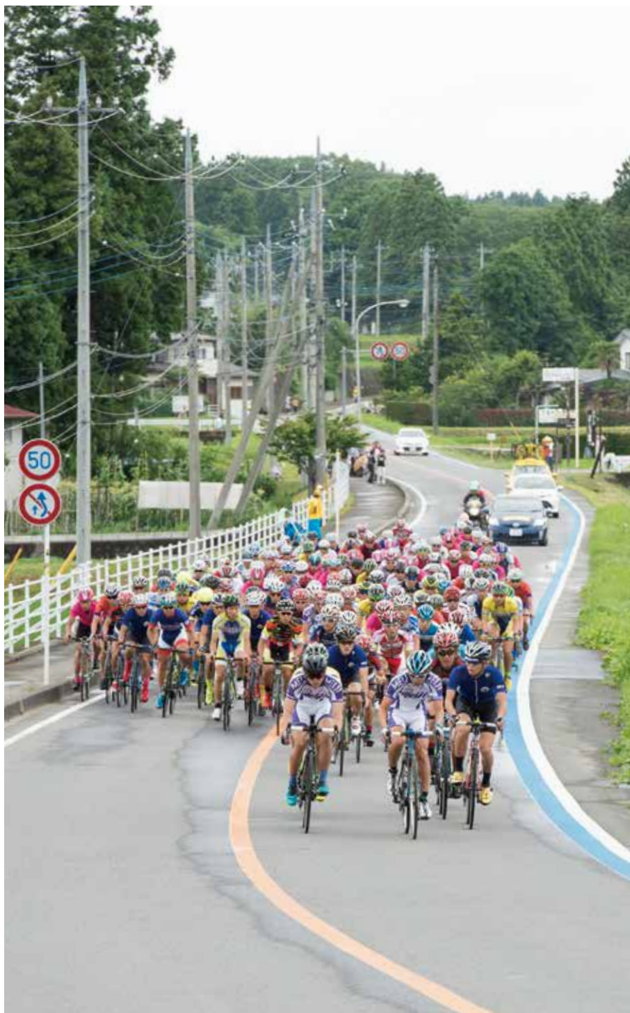
男子 U23 ロード