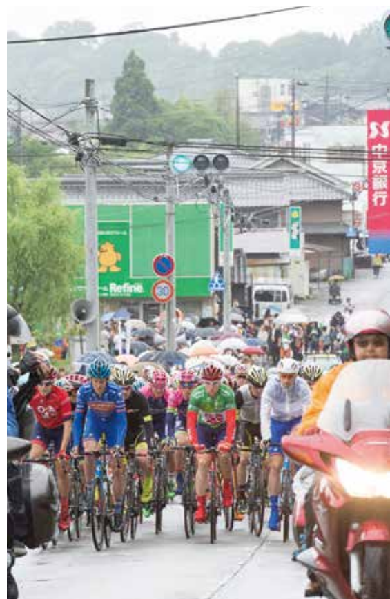
新ステージいなべのパレードスタート