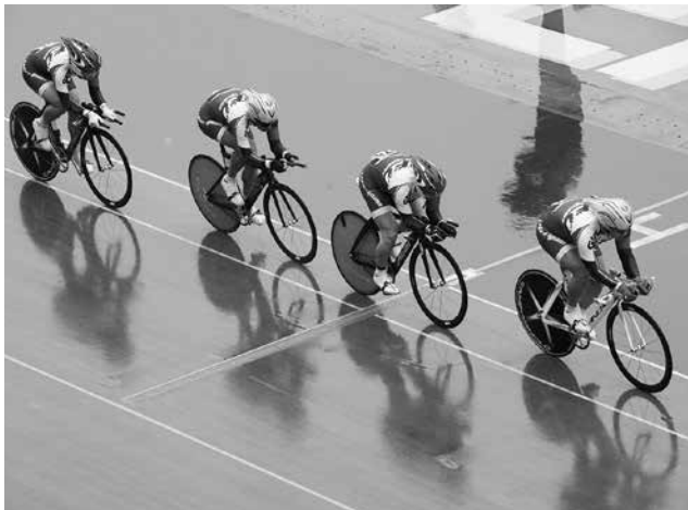
4km チームパーシュート1位中部