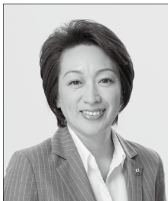
公益財団法人 日本自転車競技連盟 会 長 橋 本 聖 子

このたび 2015 全日本自転車競技選手権大会オムニウムと 2015 全日本自転車競技選手権大会マスターズが、ここ静岡県伊豆市の日本サイクルスポーツセンター・伊豆ベロドロームで開催されますことを誠に喜ばしく思います。