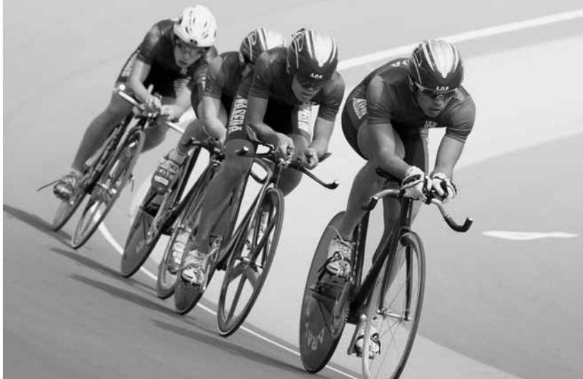
団体追抜競走優勝の学連チーム