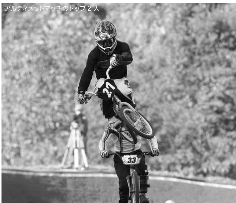
アルティメットマッチのトップ2人