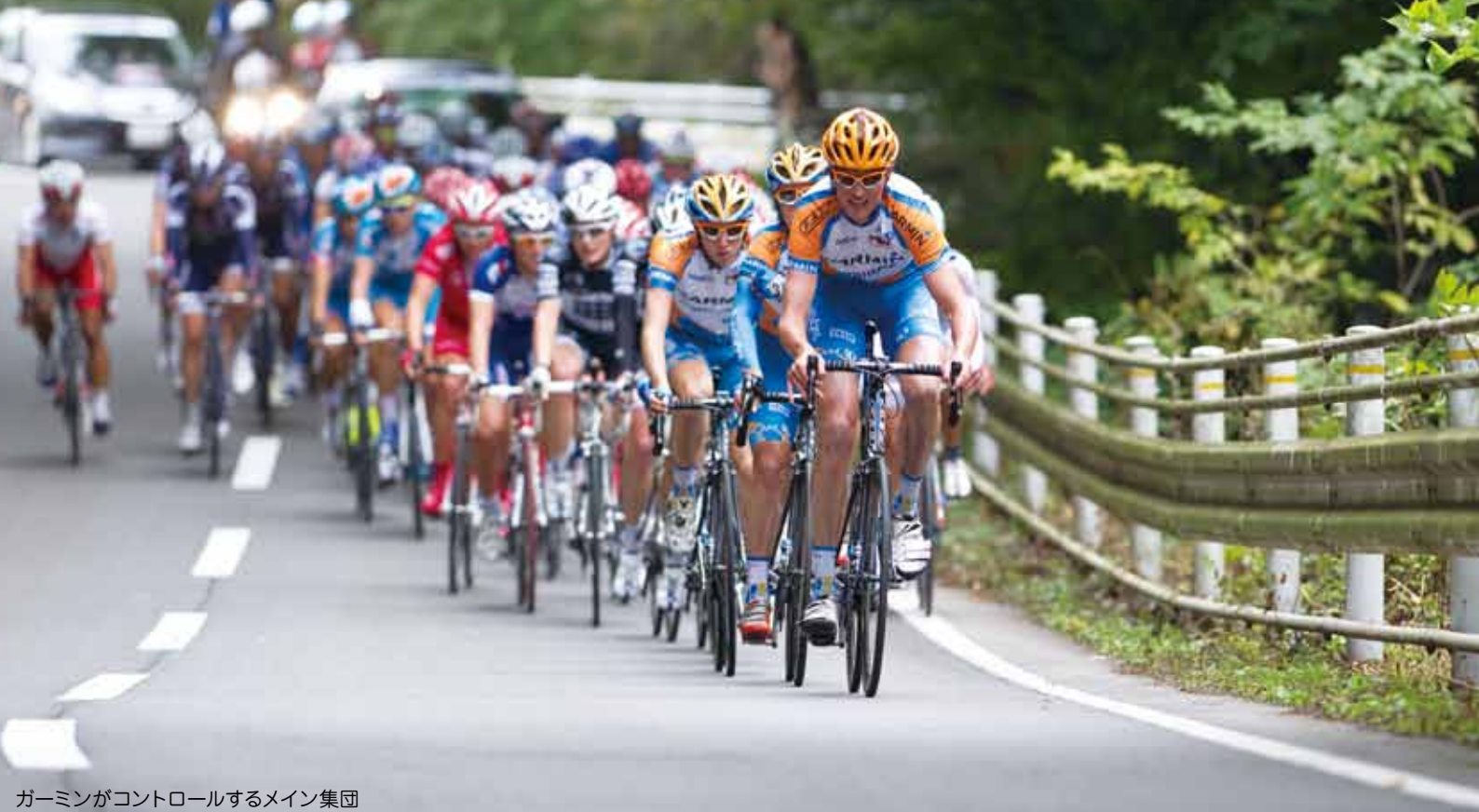
ガーミンがコントロールするメイン集団