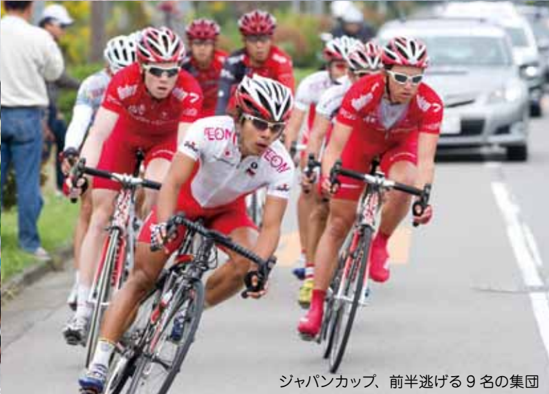
ジャパンカップ、前半逃げる9名の集団