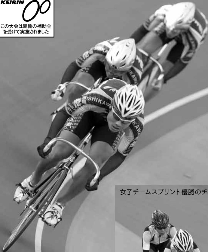
女子チームスプリント優勝のチームS・J