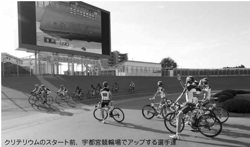
クリテリウムのスタート前、宇都宮競輪場でアップする選手達