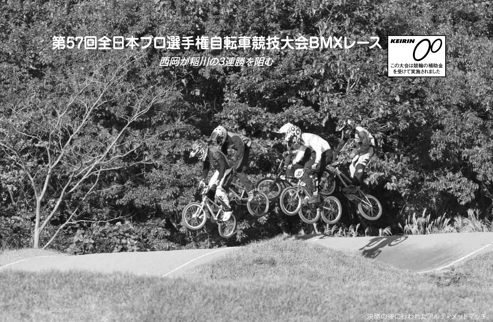
決勝の後に行われたアルティメットマッチ