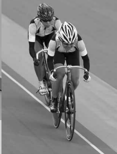
男子チームスプリント優勝の中部チーム