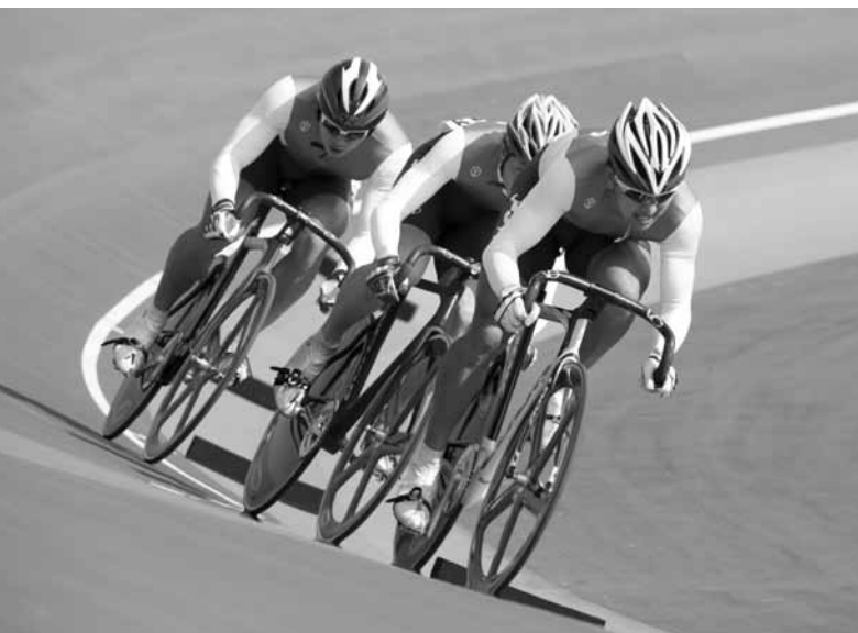
男子チームスプリント 優勝の強化チーム