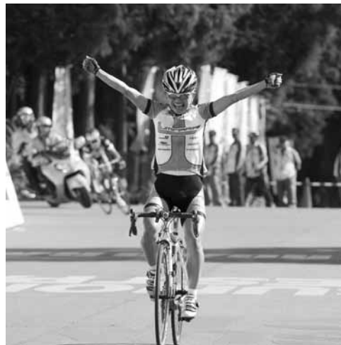
オープン男子の勝者、小段 オープン女子の勝者、西