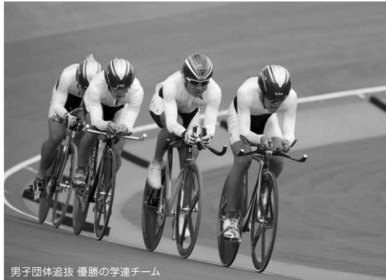
男子団体追抜 優勝の学連チーム