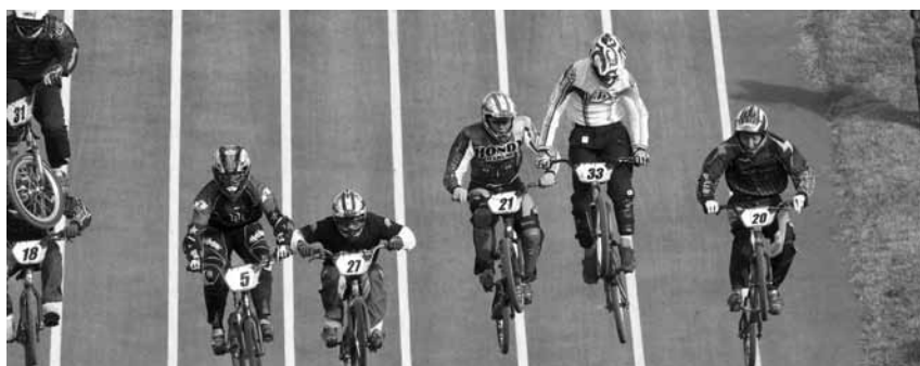
決勝のスタート直後