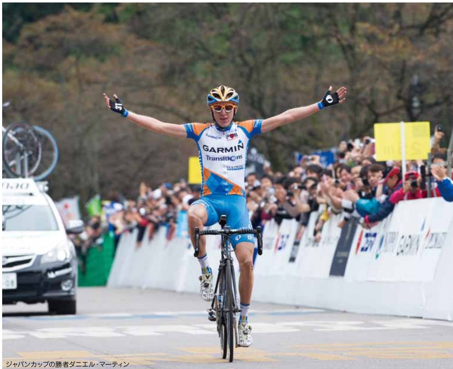
ジャパンカップの勝者ダニエル・マーティン