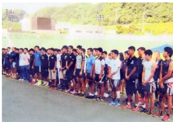
平成 28 年 12 月 21 日～25 日 全国高体連トラック合宿（伊豆サイクルスポーツセンター）