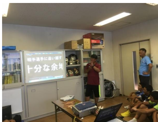
平成28年08月26日～28日 近畿ブロック合宿（京都・向日町競輪場）