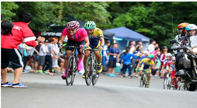
全日本大学対抗選手権（ロード）