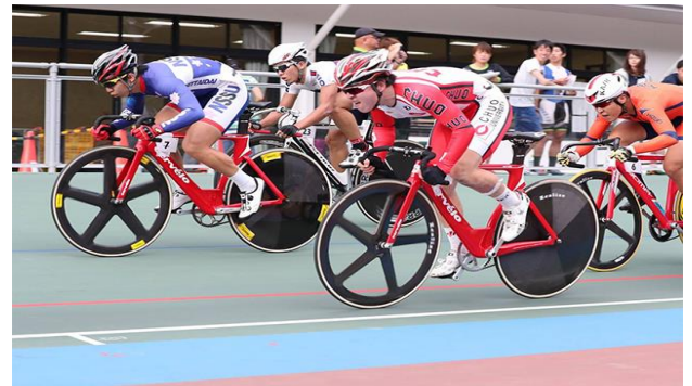
全日本学生選手権トラック大会