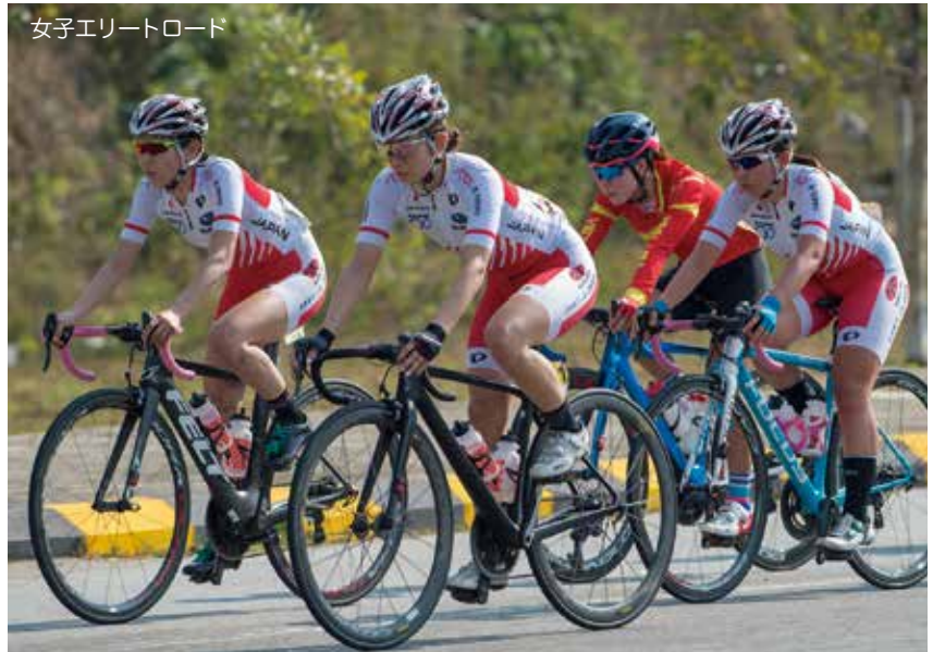
女子エリートロード

日本チームは勝負所の登り区間で出来た先頭集団に複数人を送り込めず、唐見1人になってしまった。ラスト1.5kmで先頭集団に追いついた10