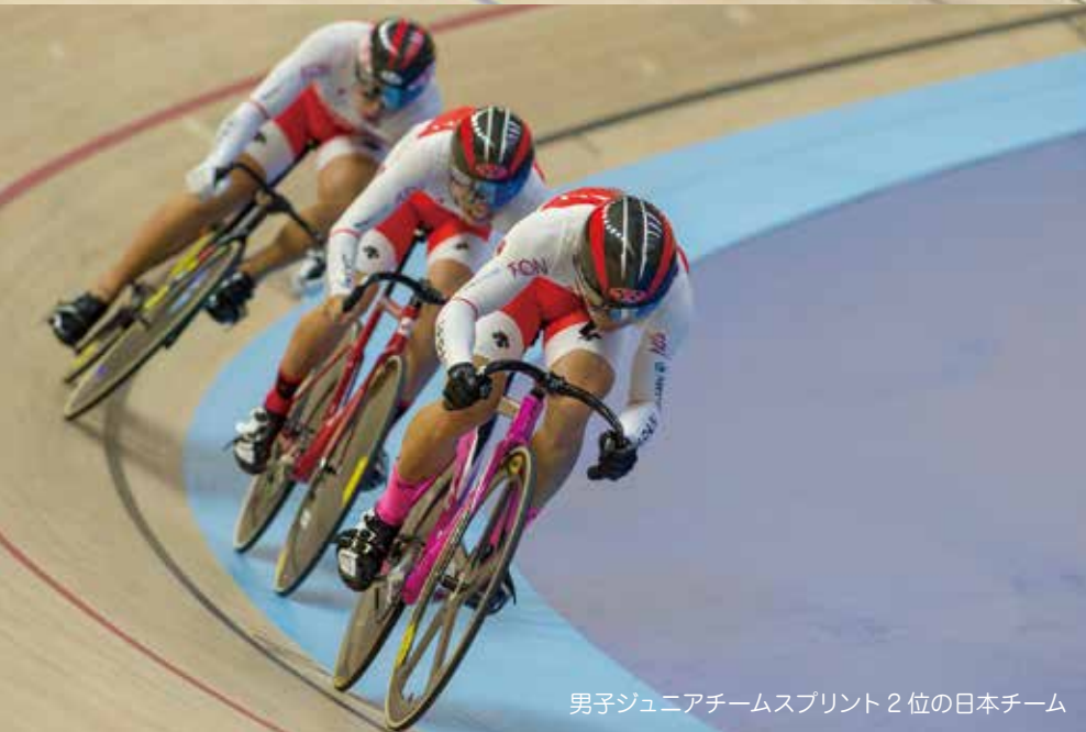
男子ジュニアチームスプリント 2位の日本チーム