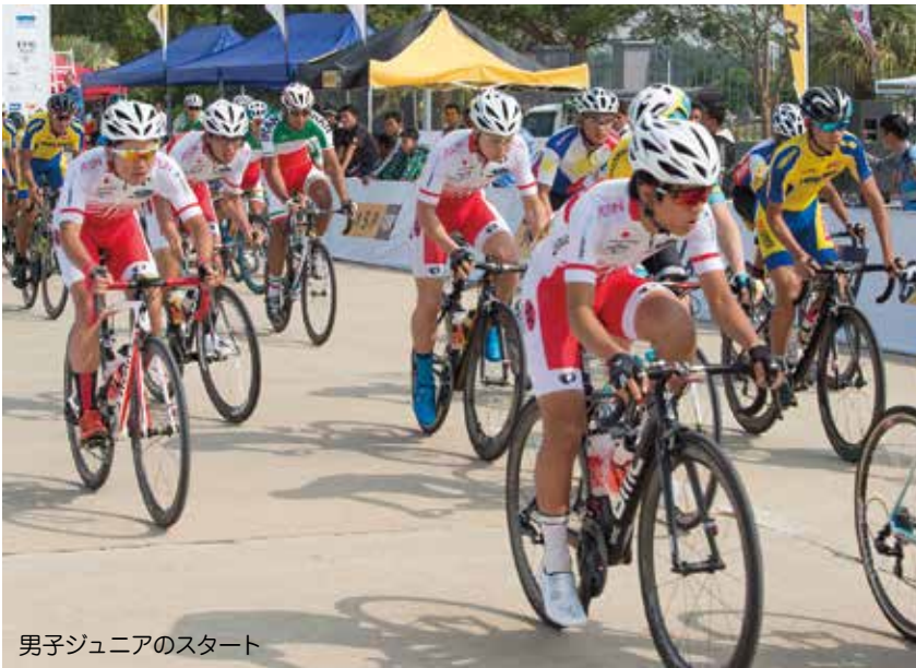
男子ジュニアのスタート

身が脚を使う形になってしまい、チームの力を結果に結びつけるという意識に課題が残った。