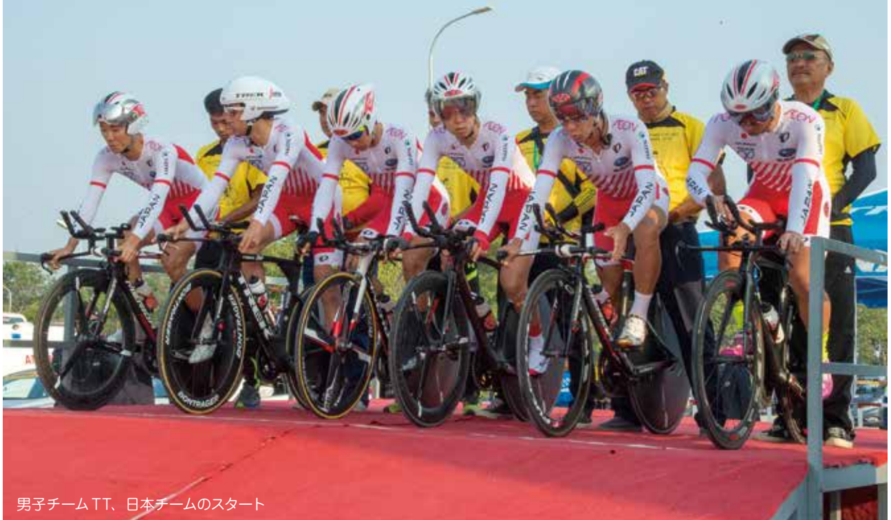
男子チームTT、日本チームのスタート