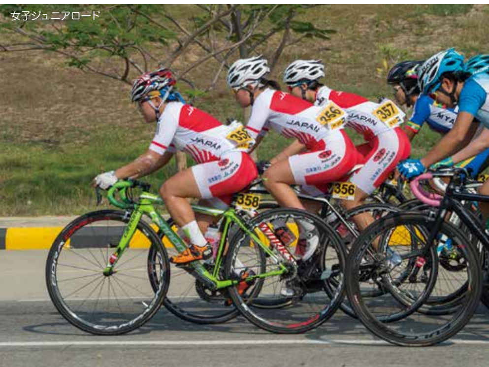
女子ジュニアロード