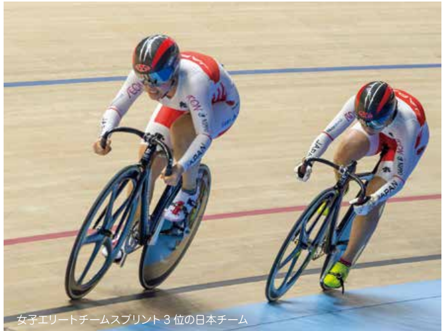
女子エリートチームスプリント 3位の日本チーム