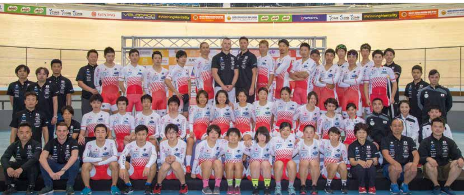
トラック全選手団