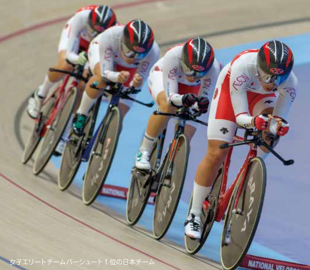
女子エリートチームパシュート1位の日本チーム