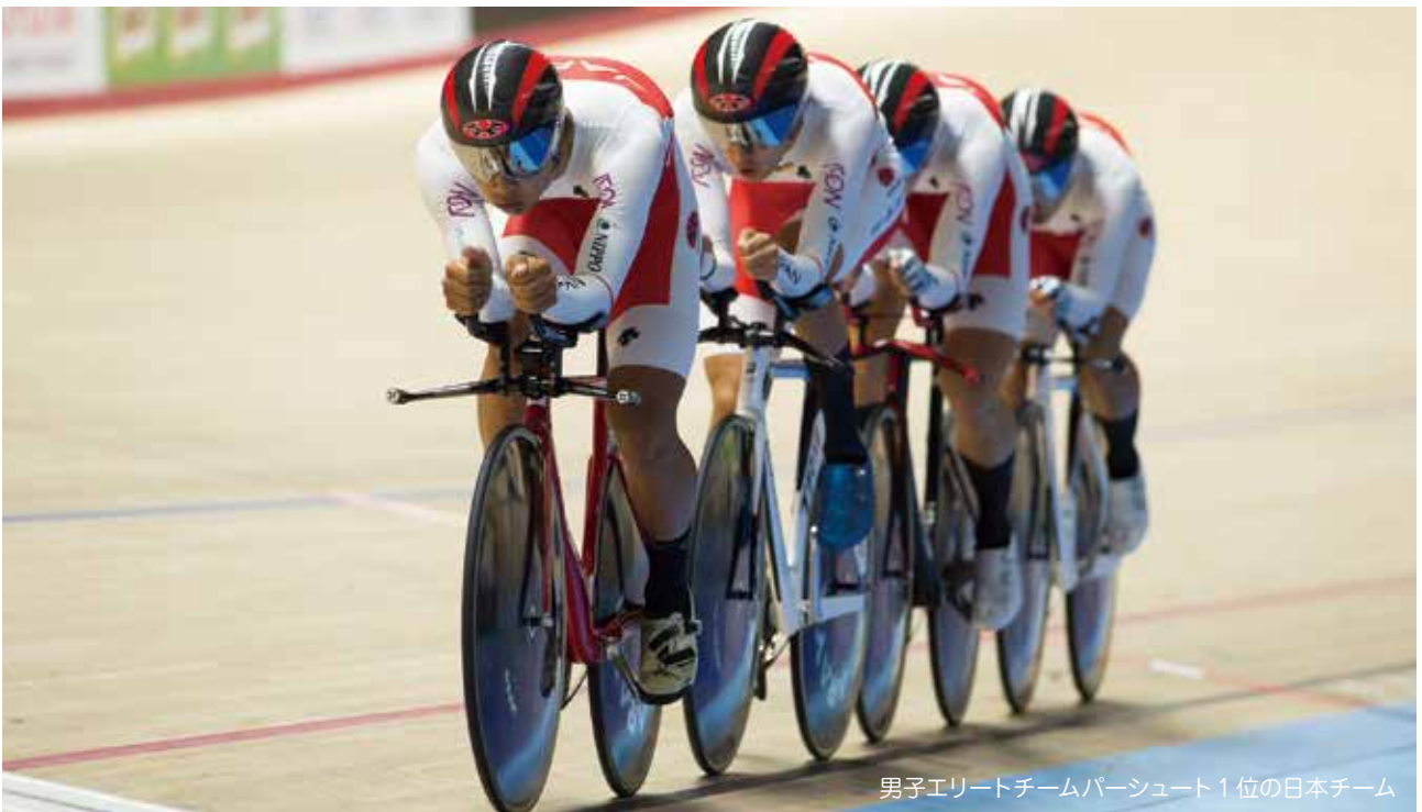
男子エリートチームパーシュート1位の日本チーム