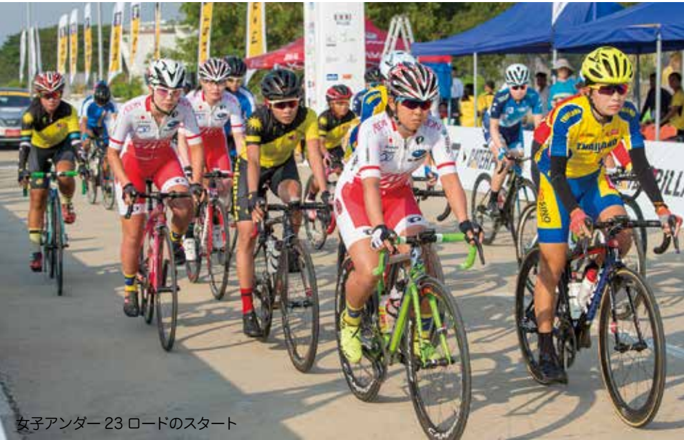
女子アンダー23 ロードのスタート