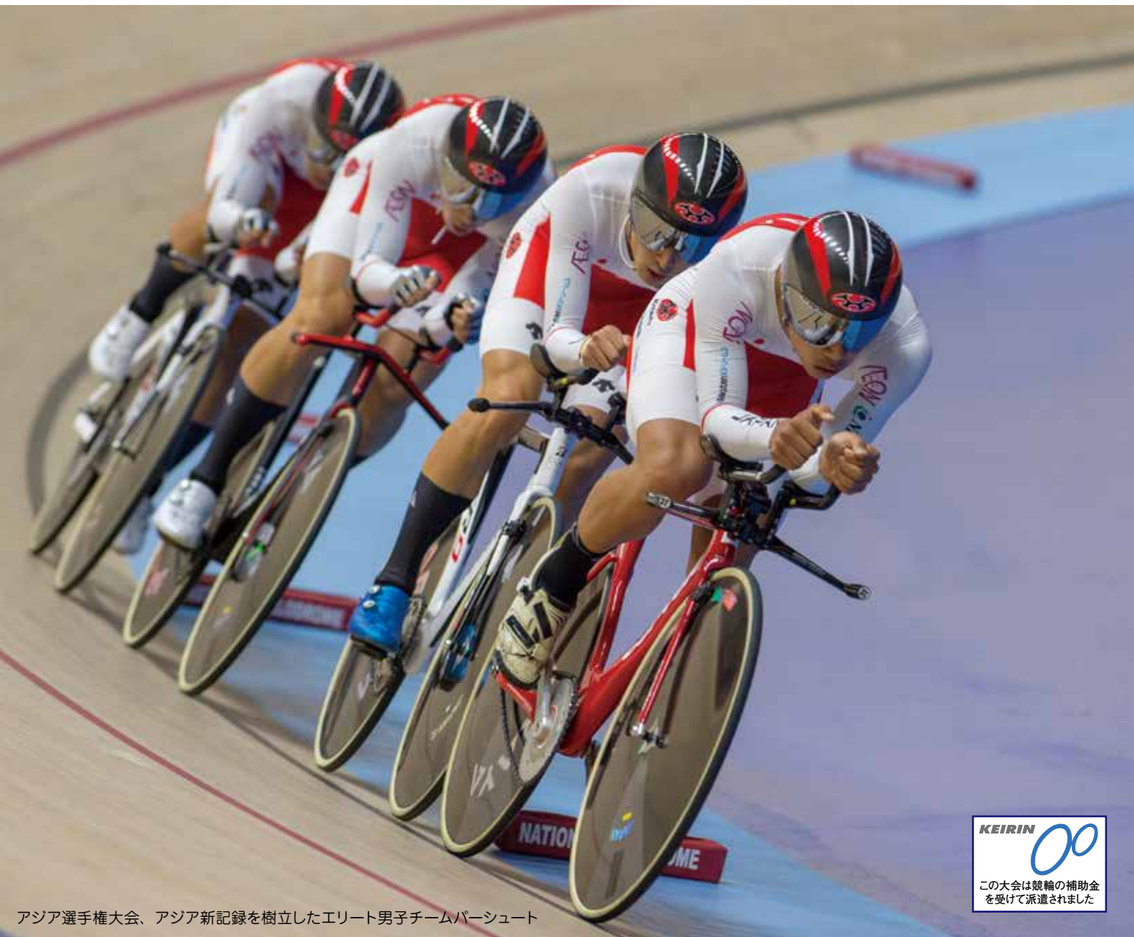
アジア選手権大会、アジア新記録を樹立したエリート男子チームパーシュート