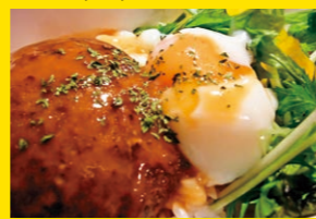
ロコモコ丼(ハワイ)