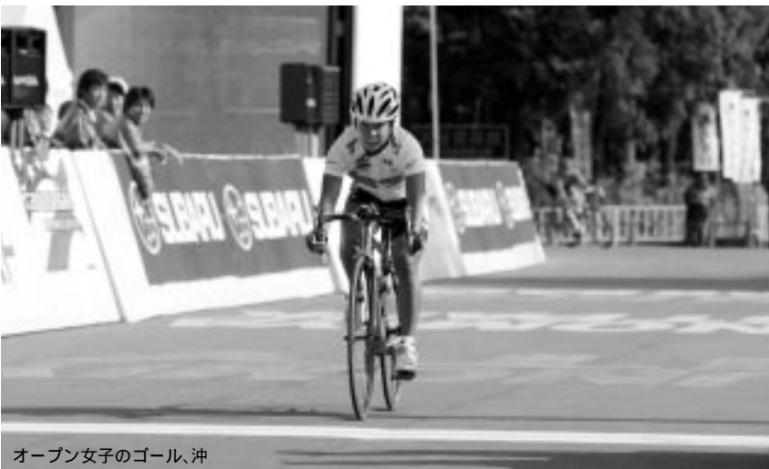
オープン女子のゴール、沖