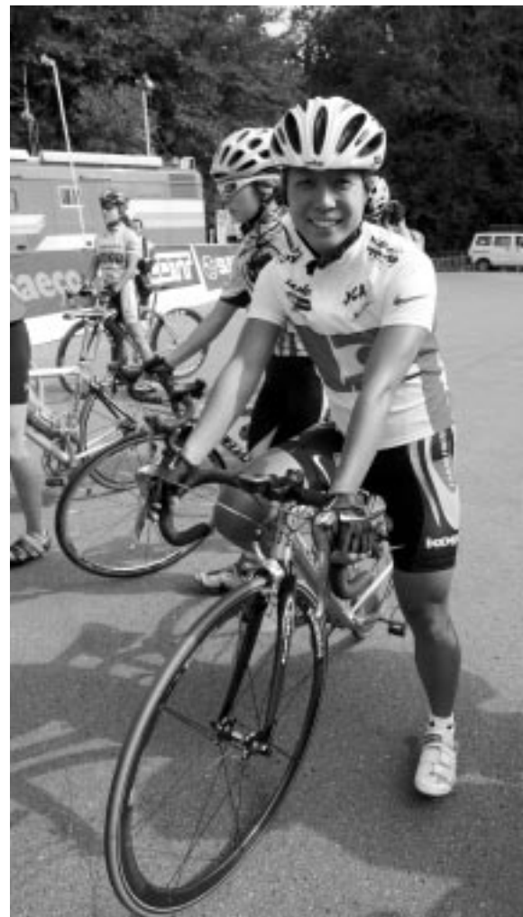
スタート前、オープン女子の沖