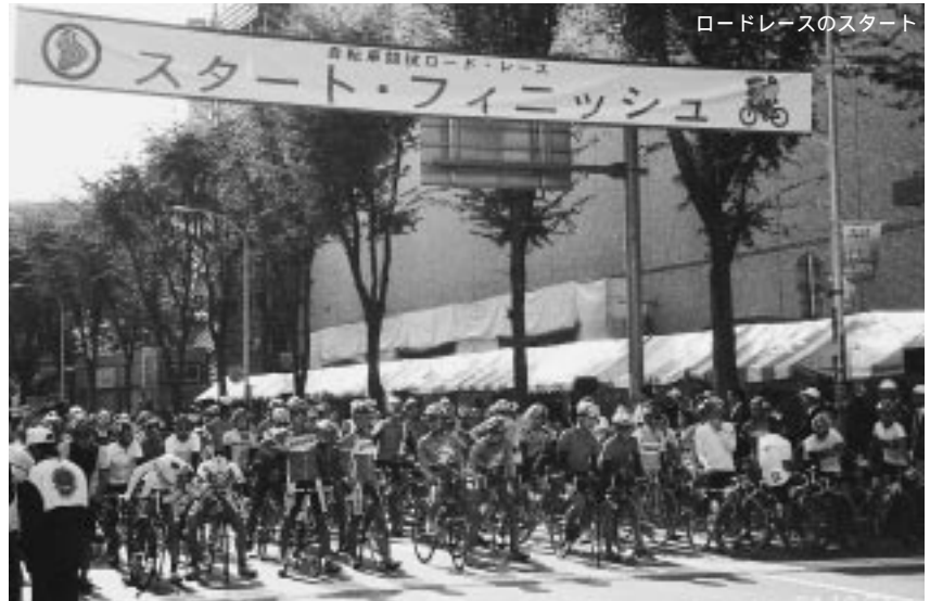
ロードレースのスタート