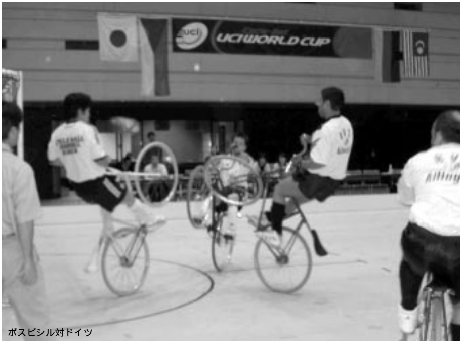
ポスピシル対ドイツ