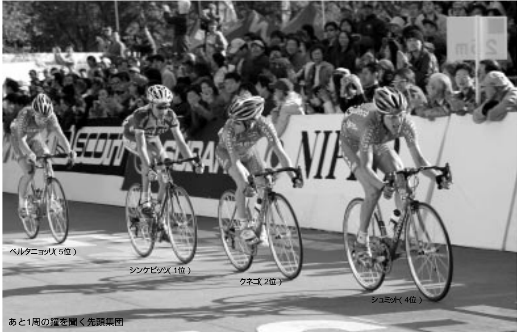
ベルタニヨツリ(5位)

先頭集団は2周目の13km地点、池のポイントでメイン集団に2分30秒の差を付けるが、これがこのレースで記録された最大の差となる。メイン集団は3周目の8km地点、中坪のポイントまでに先頭集団との差を1分45秒まで詰めると、以降はその差が1分40秒前後で推移しレースが進んでいく。例年