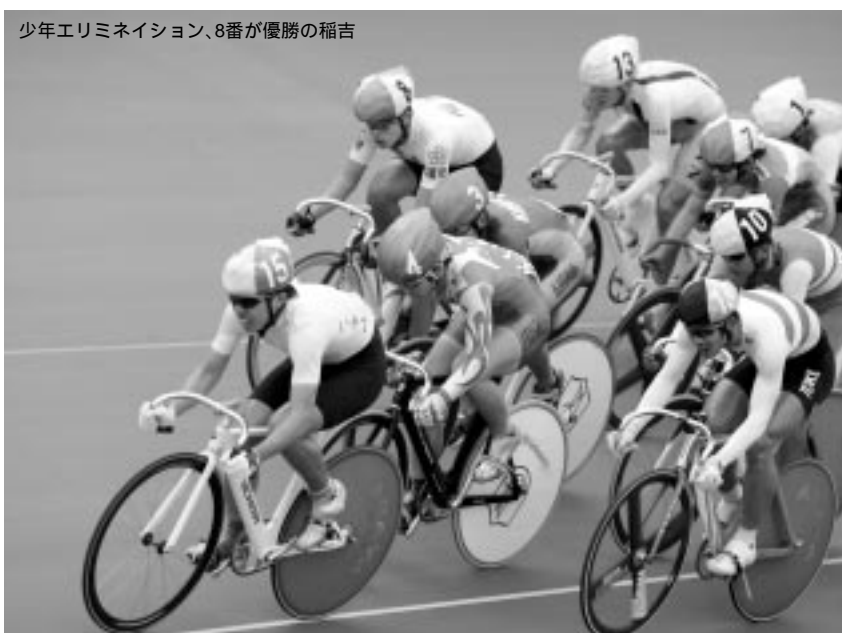
少年エリミネーション、8番が優勝の稲吉