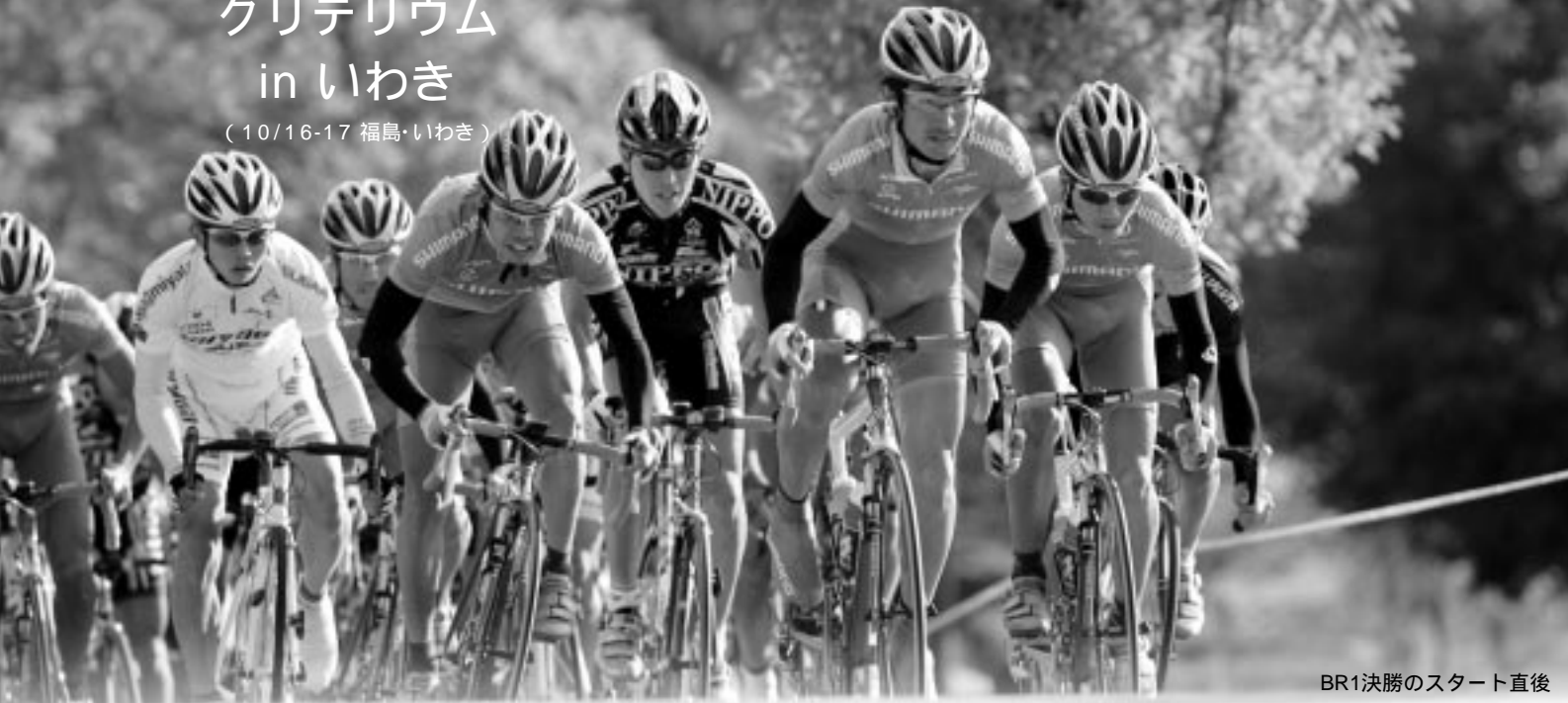
BR1決勝のスタート直後