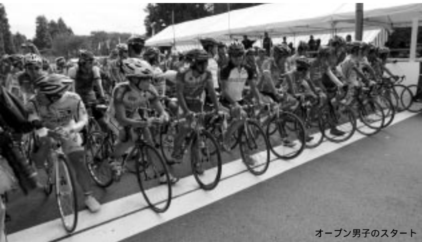
オープン男子のスタート