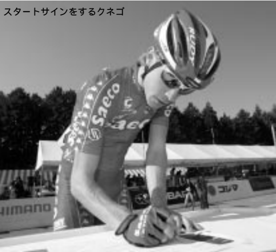
スタートサインをするクネゴ

でも6位に入賞しているクネゴ人気も手伝ってか、ジャパンカップの舞台となる宇都宮森林公園周回コースには、主催者発表で50,000人という例年以上の大観衆が集まった。