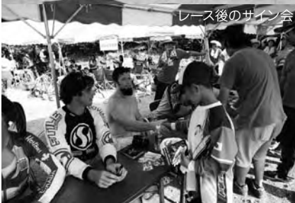
レース後のサイン会