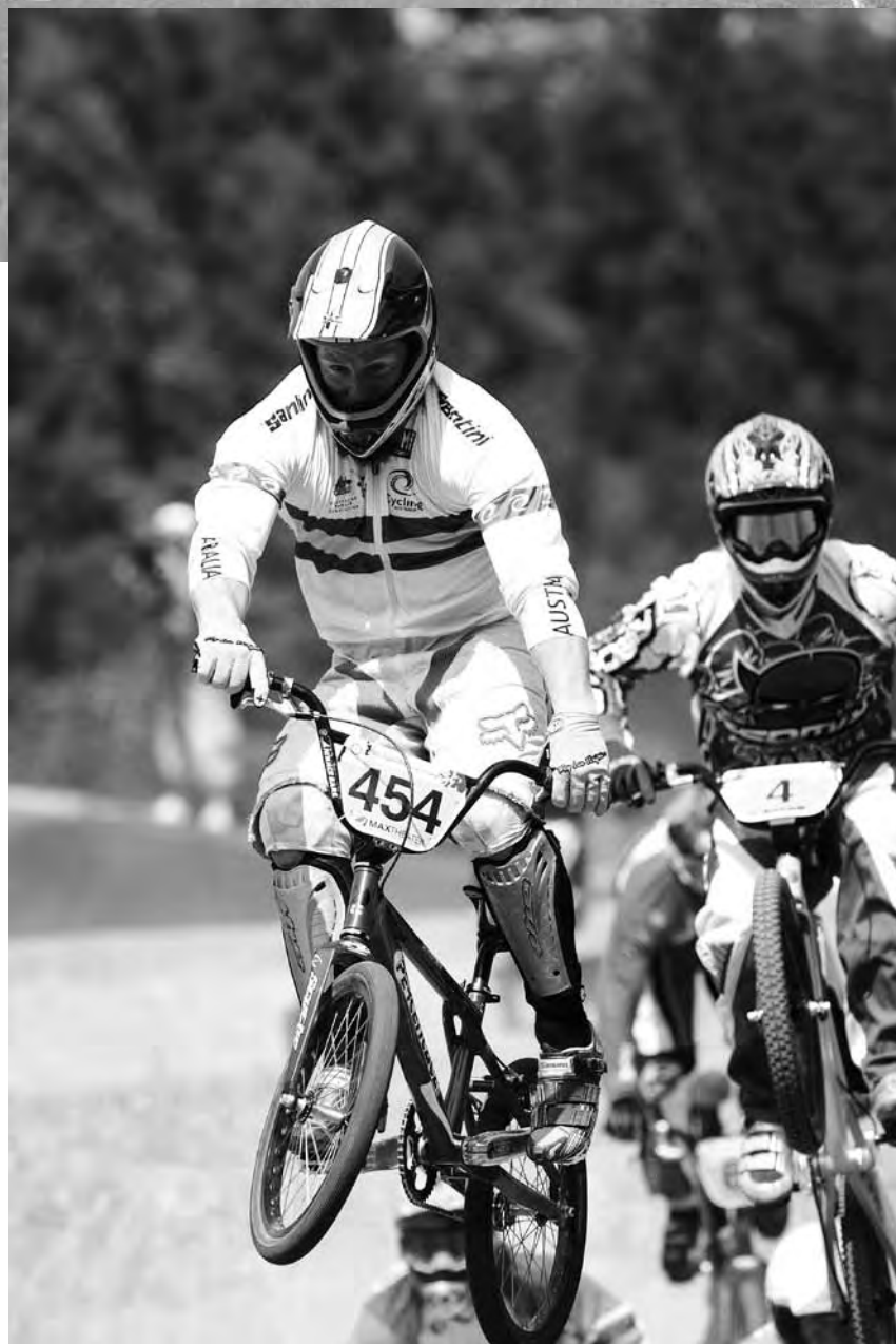
男子エリートの勝者 Kakakaji

本大会開催にあたり新潟県上越市にご支援、ご協力を賜り深く感謝申し上げますとともに、7月の新潟県中越沖地震で震災に遭われた皆様にお見舞い申し上げます。そして一日も早い復興を願っております。