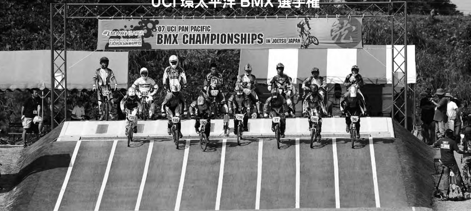
女子エリートのスタート

戦国時代の名将上杉謙信の城下町としても有名な新潟県上越市で「2007年 UCI 環太平洋 BMX 選手権 上越日本大会」が8月11日に開催され、UCIポイントのかかったこの大会に海外から約30名の選手が参加した。日本では、1997年に東京・稲城市で初開催、2001年5月に上越市、2005年9月に茨城県日立市と続き、今回4度目の日本開催となった。