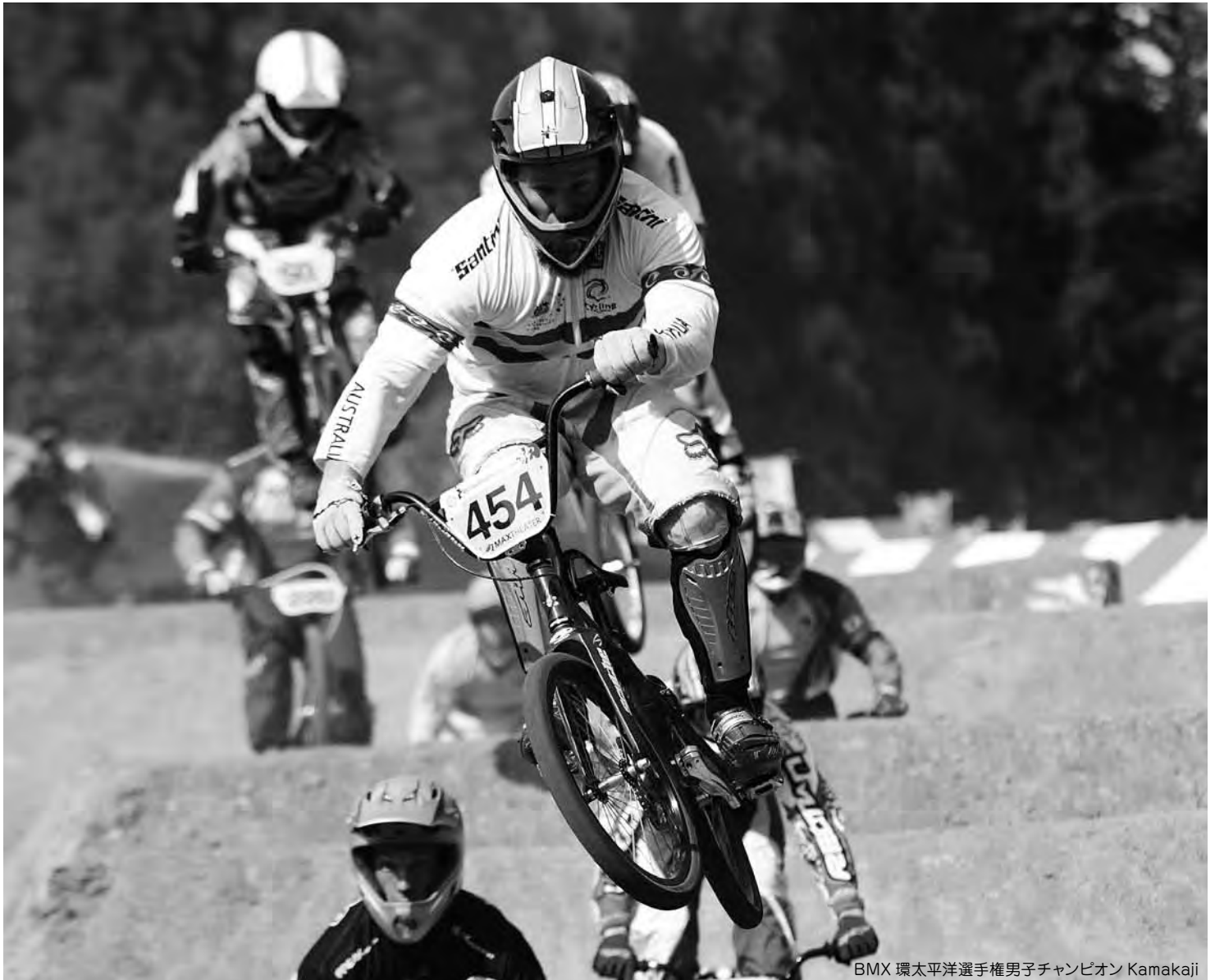
BMX 環太平洋選手権男子チャンピオン Kamakaji