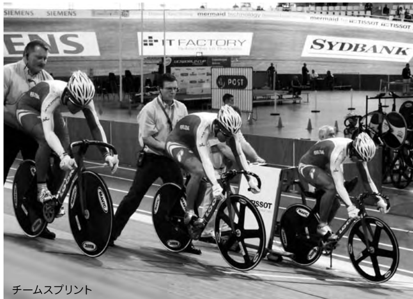
チームスプリント