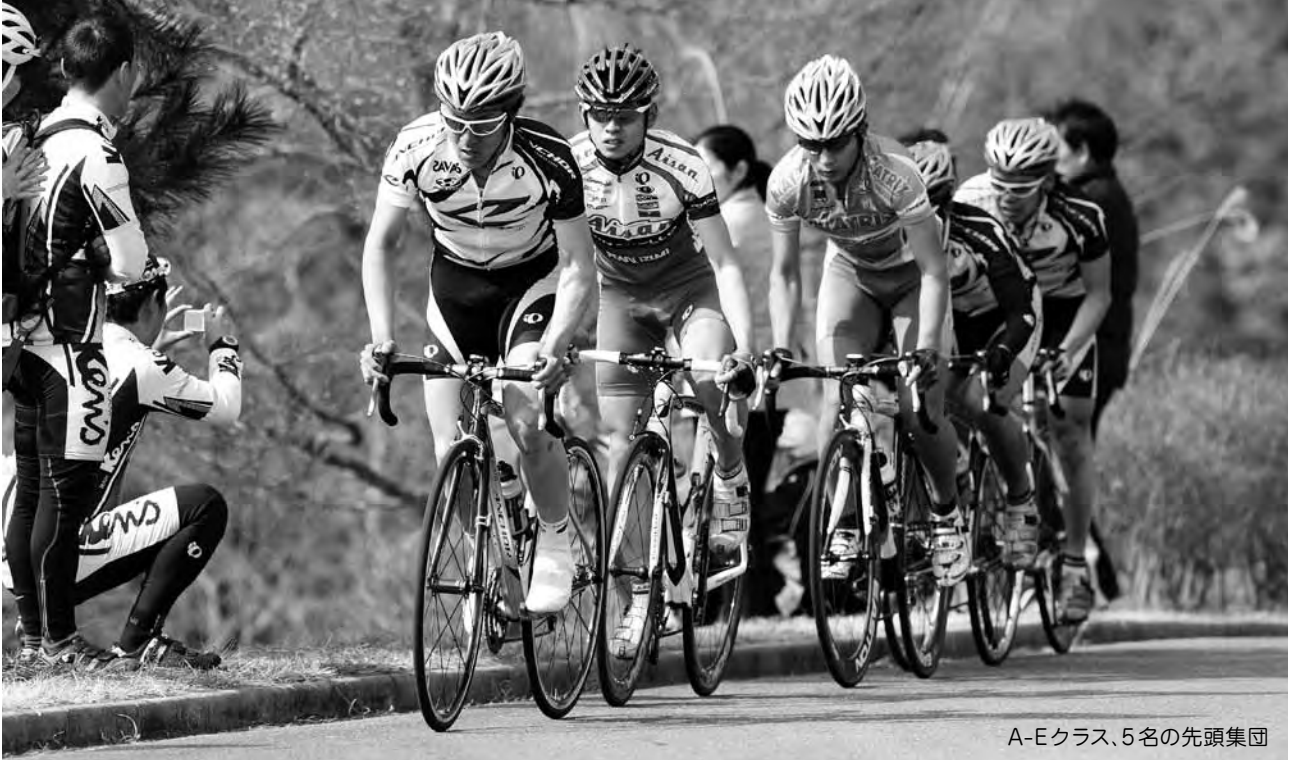
A-Eクラス、5名の先頭集団