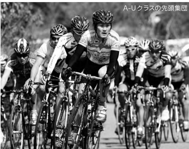
A-Uクラスの先頭集団