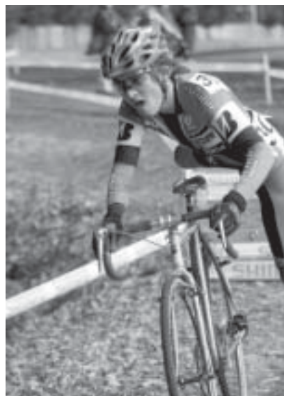
3位の鈴木雷太が人工障害物をクリアする

しかし8周目、外周コースの南側で(フィニッシュは北側)小平がアタックし差を広げる。その差は最終コーナー