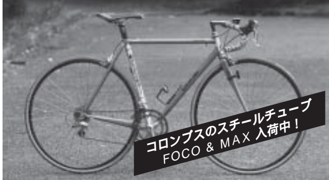
レースで培った安定した走行感とライダーとの一体感。ナカガワのフルオーダーフレーム。