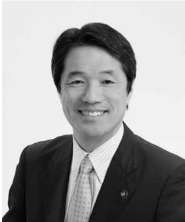
伊豆市長 菊地 豊

美しい自然と温暖な気候に恵まれたこの伊豆の地で、昨年に引き続き、「2012年JOCジュニアオリンピックカップ自転車競技大会」が開催されることとなり、大変喜ばしく思っております。