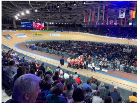
世界選手権大会・ドイツ